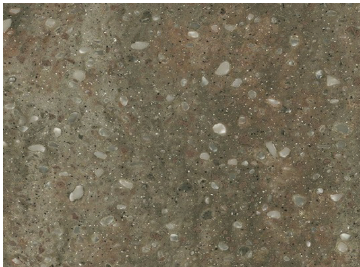
Originalgrösse: 1 cm