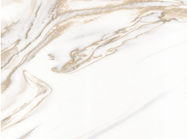
Originalgrösse: 1 cm