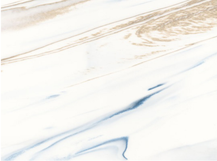
Originalgrösse: 1 cm